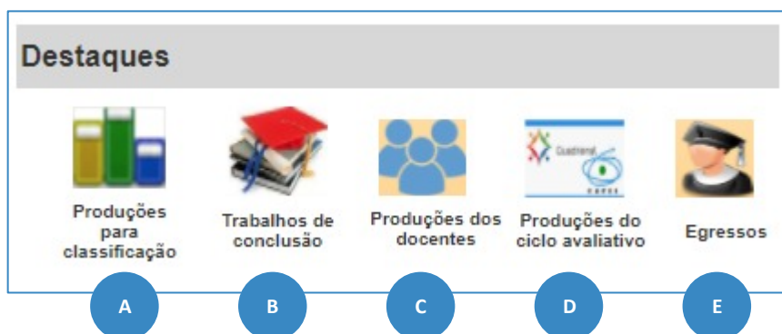
Figura 1. Módulo de Destaques na Plataforma Sucupira

2.3 A Plataforma Sucupira disponibilizará uma seção específica para destaques, conforme Figura 1.