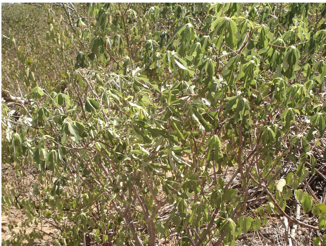
Figura 4 – Maniçoba ( Manihot pseudoglaziovii (Bong.) Steud.) utilizada para amostragem