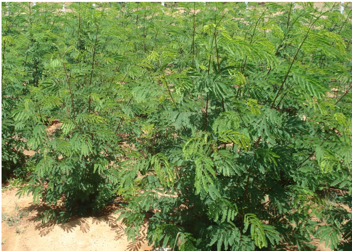
Figura 3 – Leucena ( Leucaena leucocephala Lam.) utilizada para amostragem