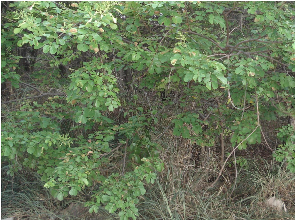
Figura 6 – Sabiá ( Mimosa caesapiniifolia Benth) utilizada para amostragem