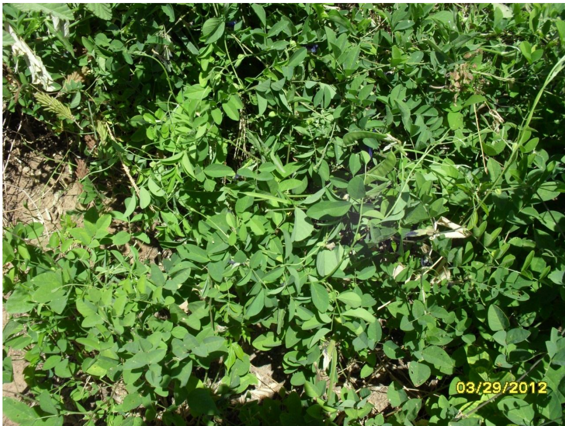
Figura 1 – Cunhã ( Clitorea ternatea ) utilizada para amostragem