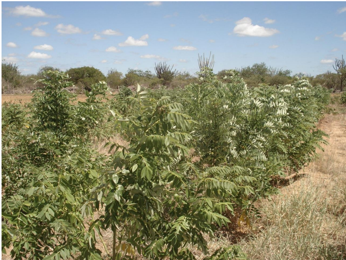
Figura 2 – Gliricídia ( Gliricidia sepium ) utilizada para amostragem