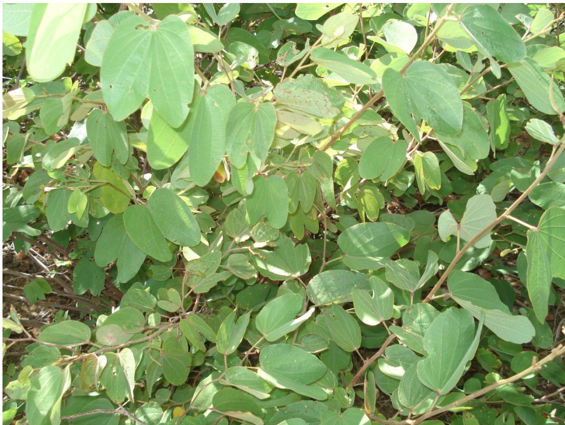
Figura 5 – Mororó ( Bauhinia cheilantha (Bong.) Steud.) utilizada para amostragem